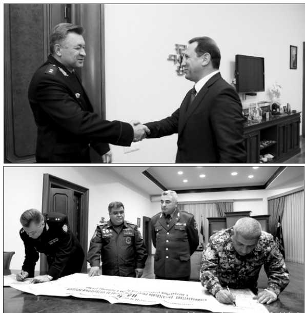
Սկիզբը՝ եջ 1

Պլանը մշակվել է 1994-ին կնքված «Հայաստանի Հանրապետության և Ռուսաստանի Դաշնության միջև արդյունաբերական վթարների, տարերային աղետների կանխարգելման և դրան տեղ ուսումնասիրման վերացման ոլորտում համագործակցության մասին» համաձայնագրի հիման վրա: