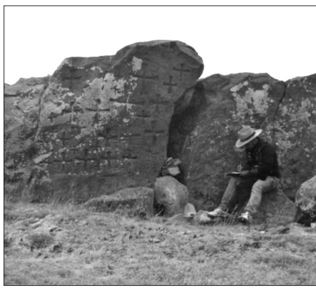
Նկ. 3. Մի դրվագ Սևանի հարավարևելյան ավազանի հնագիտական հուշարձանների ուսումնասիրությունից

Տապանագրում ասվում է, որ մարդկանց մեղքերից բարկացավ Աստված և 11 հոգի զոհվեցին երկրաշարժից: Սա, փաստորեն, եղբայրական գերեզման է: Թեև թվականը չի նշված, սակայն արձանագրությունը առաջինն ուսումնասիրած վիճակագրատու Ս. Բարխուդարյանը կարծում է, որ նախորդի հետ մույն ժամանակն է: Այս տապանագրերը հնաերկրաշարժագիտական տեսանկյունից հետազոտել են նաև Վ. Տրիֆոնովը և Ա. Կարախանյանը, որոնք կարծում են, որ հիշատակվող երկրաշարժը համապատասխանում է հայկական մատենագրական սկզբնաղբյուրներից հայտնի 1319 թ. երկրաշարժին, որն ավերածություններ է գործել Շիրակից Սյունիք ընկած գոտում: Այս վարկածը