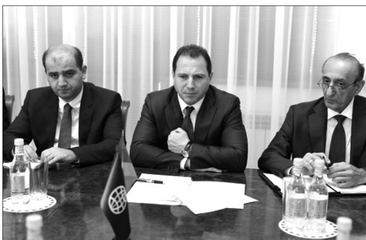
որակյալ կադրային բազա կստեղծի հետագա բարեփոխումների համար: Նախատեսվում է 2018-ի գարնանը կազմակերպել միջազգային դոնորների համաժողով՝ «Հիդրոմետ» ծառայության արդիականացման համար անհրաժեշտ ֆինանսական միջոցներ ներգրավելու նպատակով: ■