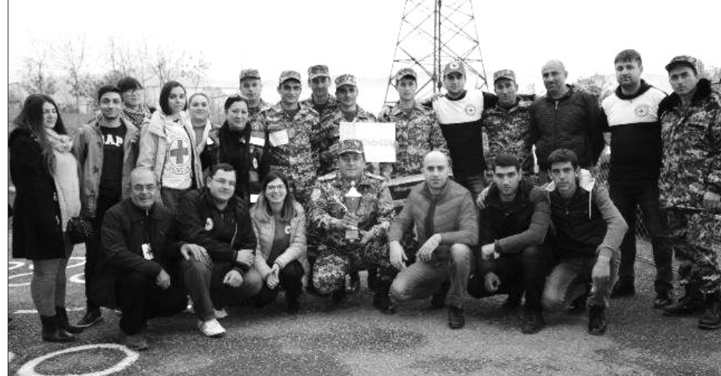
վարժանքներ: Հայ-վրացական համատեղ վարժանքն անցած շաբաթ էր: Հիմա Եվրոպայում վերապատրաստված մեր մասնագետները վերապատրաստման դասընթացներ են անցկացնում Տավուշի և Սյունիքի փրկարարների համար: Դասընթացները կավարտվեն նոյեմբերի երրորդ տասնօրյակում: Արդյունքների մասին դրանից հետո: Քիմիական, կենսաբանական, միջուկային և ճառագայթային (ԶԿՄԾ) զերազանցությունների կենտրոնների 44-րդ ծրագրով նախատեսված է ոչ միայն արձագանքման ուժերի ստեղծում, այլ նաև կարողությունների զարգացում: Այլ խոսքով՝ ծրագիրը շարունակական է, ու ազգային, համատեղ վարժանքները, վերապատրաստման դասընթացները չեն բացառվում: ■

Հայաստանում սկսվել է Եվրոպական միության աջակցությամբ այս տարեկալին մեկնարկած քիմիական, կենսաբանական, միջուկային և ճառագայթային (ԶԿՄԾ) զերազանցությունների կենտրոնների 44-րդ ծրագրի եզրափակիչ փուլը: Ծրագիրն իրականացվում է 9 երկրում՝ Հայաստան, Վրաստան, Ուկրաինա, Մոլդովա, Սերբիա, Չեռնոգորիա, Խորվաթիա, Բոսնիա-Յերզովինա: Նպատակն է ձևավորել քիմիական, կենսաբանական, ճառագայթային արձագանքման խմբեր, որոնք աշխատելու են սահմանային անցակետերում: Փետրվարին, մարտին, մայիսին վերապատրաստման դասընթացներ կազմակերպվեցին Երևանում, Թբիլիսիում, Կիևում, որոնց մասնակցեց 81 մարդ, ամեն երկրից 9 հոգի: Հայաստանի ներկայացուցիչներից 6-ն արտակարգ իրավիճակների նախարարությունից են: Հետո երկրներն անհրաժեշտ զույգ ստացան: Հայաստանը՝ 230 հազար եվրոյի անհատական պաշտպանության միջոցներ, քիմիական, կենսաբանական, ճառագայթային ազդակների հայտնաբերման սարքեր և այլն: Սրան զուգահեռ Եվրոպայում վերապատրաստված մեր մասնագետները վերապատրաստման դասընթացներ անցկացրեցին Շիրակի և Լոռու փրկարարների համար, երկրներն անցկացրեցին ազգային և համատեղ դաշտային ու շտաբային